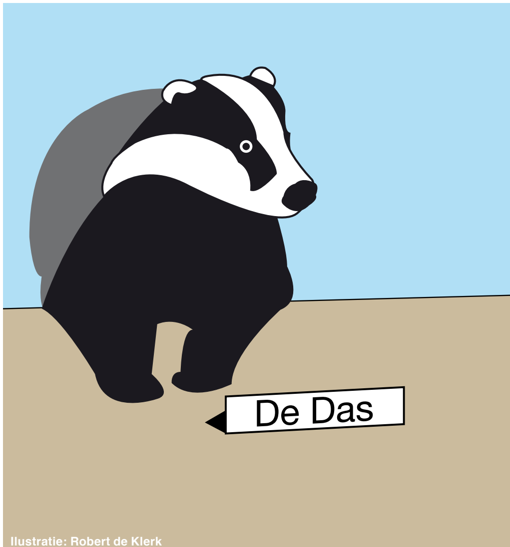
Illustratie: Robert de Klerk